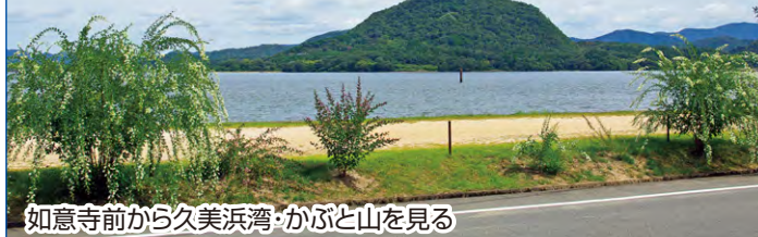
如意寺前から久美浜湾・かぶと山を見る